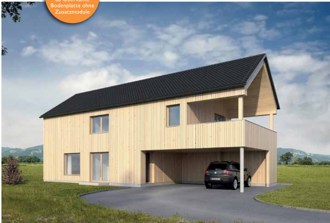
Abbildung mit Zusatzmodul 1 PKW + 1 Terrasse